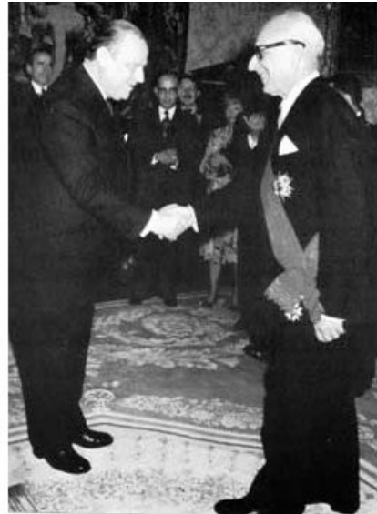
Remise de la Grand Croix de la Légion d'honneur à l'Hotel Matignon, le 25/10/1978, par Raymond BARRE

Fig. 9. Avions renifleurs : des polytechniciens, Pierre Guillaumat, "corps des mines", Gilbert Rutman, "corps des mines" et Paul Alba, comme s'ils avaient toujours le doigt sur la couture du pantalon, disent avoir obéi à la lettre.