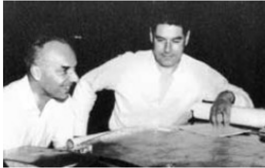
Fig. 1. Pierre Guillaumat et Jean Blancard en 1950 (in annales.org). Ces deux X-Mines sont passés en douceur du régime de Vichy au gouvernement provisoire à la IV e république puis à la V e . C'est ainsi que se sont construits ces deux piliers du "corps des mines". Tous deux passeront aussi à la Défense à un moment donné de leur carrière.