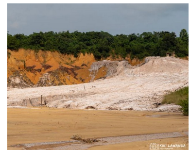
Fig. 8. A gauche l'un des effondrements à la surface, profondeur 20 mètres, au dessus de la mine de potasse de Holle suite à son inondation brutale définitive en juin 1977, mine dirigée par l'EMC et ELF-ERAP (in Feuga 2009). A droite, 45 ans après l'exploitation, autre vestige : le "glacier de sel"

D'énormes investissements sont réalisés pour la CPC avec emprunts notamment à la Caisse française de développement dans le cadre du FIDES, la BEI, Banque Européenne d'Investissements et la BIRD, Banque Internationale pour la Reconstruction et le Développement . La reconnaissance géologique avait été limitée, raison spécifiée pour laquelle la société américaine American Potash , sollicitée, a refusé la proposition de se joindre à ce gros projet (Sirven 1973, p. 191). Et de fait l'exploitation s'avère de suite nettement plus complexe