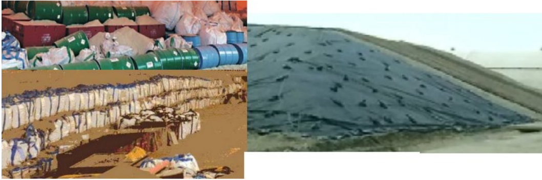
Fig. 3. Morvilliers ("Cires" ou CSTFA) à quelques km de Soulaines = tumulus des temps modernes dans les plaines de Champagne. Il en faudra beaucoup mais de simples arrêtés préfectoraux suffisent.