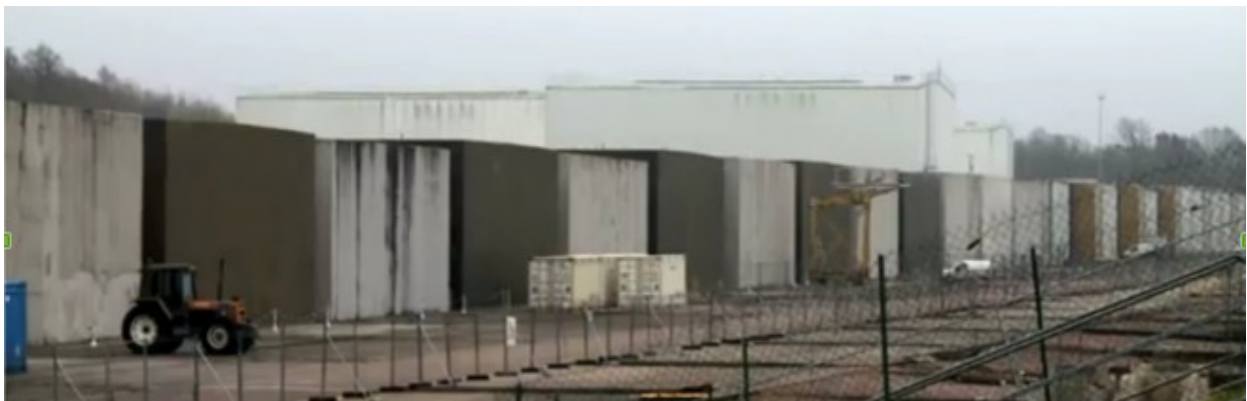
Fig. 2. Soulaines (CSA ou CSFMA) : pas loin de 2 millions de tonnes irradiantes de Areva/Orano-CEA et EDF, dans 400 cubes de béton sur une zone de recharge du célèbre aquifère des "sables verts"(puits de Grenelle)

On est sur une zone de recharge du célèbre aquifère des "sables verts" atteints à Paris en 1841 par le puits de Grenelle ( ici , là et aujourd'hui accessible dans les 13 e , 16 e et 18 e arrondissements de la ville de Paris : là ). En effet à Soulaines, " il y a un débit de fuite le long de l'aquifère vers le centre du bassin parisien " (Kaelin, "Région de Soulaines... géologie", 1990, Andra, p. 88). Et puis le ruisseau qui coule au pied des cubes de béton coule lui-même sur ces mêmes sables sur 1,5 km et fait partie de la zone de recharge de l'aquifère. Et puis lui-même par le réseau de surface aboutit au fond du compte dans la Seine.