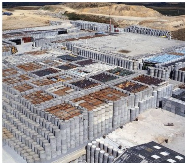
Le site de stockage des déchets à faible et moyenne activité, vie courte à La Hague.

Ces centres dont l'exploitant du jour est l'Andra sont en même temps des décharges chimiques (0,9 t de iodate de plomb, plus de 2000 tonnes de sulfates de plomb, 25 000 t de plomb métallique, plus de 90t de bore, plus de 15t de cadmium, etc.) avec plus de plomb que ce qu'est autorisée à recevoir une décharge chimique de classe 1. La couverture actuelle construite entre 1991 et 1997 a glissé en moyenne de 20-25 cm sur les flancs, et les premiers tassements commencent à apparaître au sommet (un de 50 cm et un de 25 cm). Les habitants qui habiteront là dans le futur n'ont pas fini de s'occuper de ce bébé-pisseur créé par le CEA.